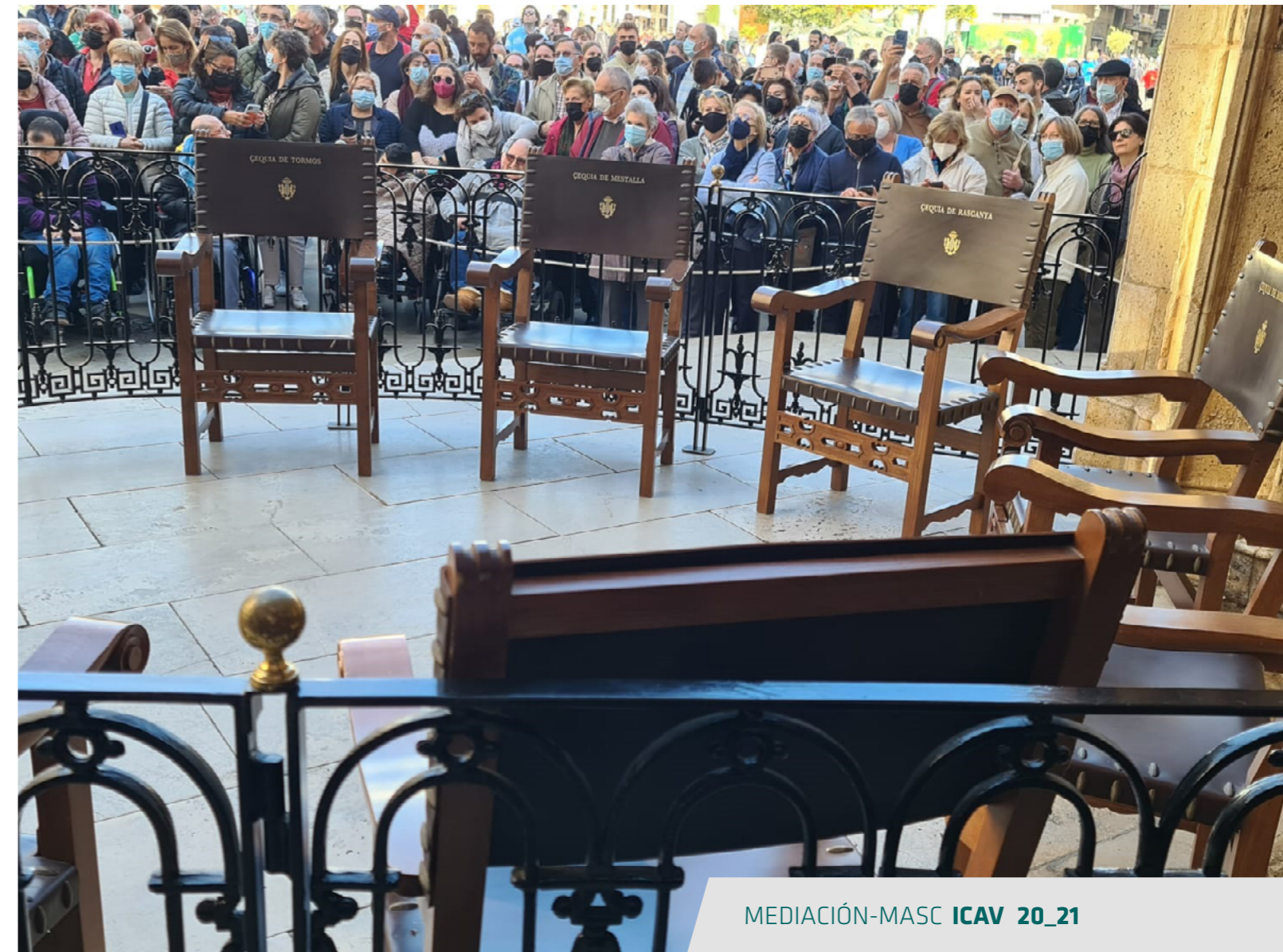
Presidenta Sección MEDIACIÓN-MASC